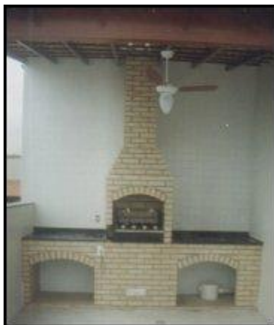
CUISINE / CHEMINÉE – FOUR Intérieur