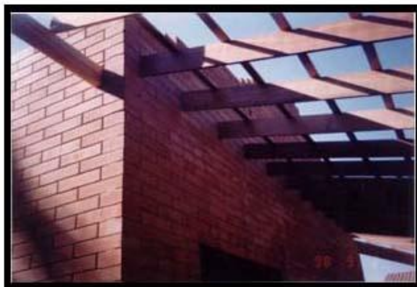
PATIO Couvert pare-soleil