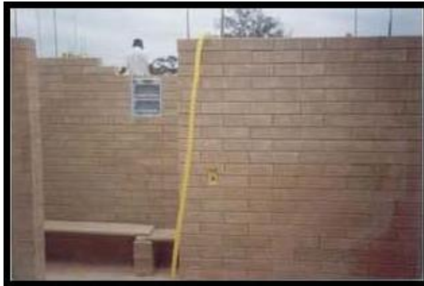
MUR Renforcé en cours de montage Observer les ferrillages