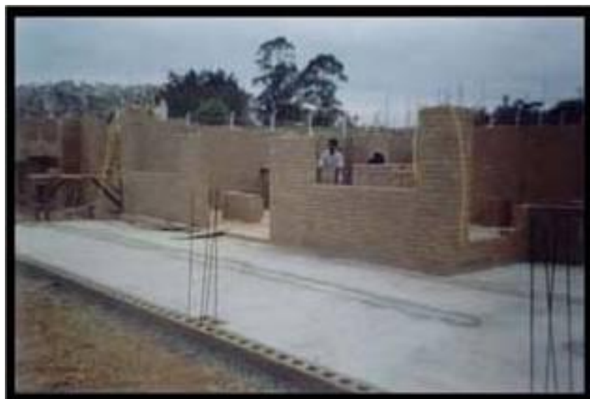
CHANTIER de CONSTRUCTION en cours