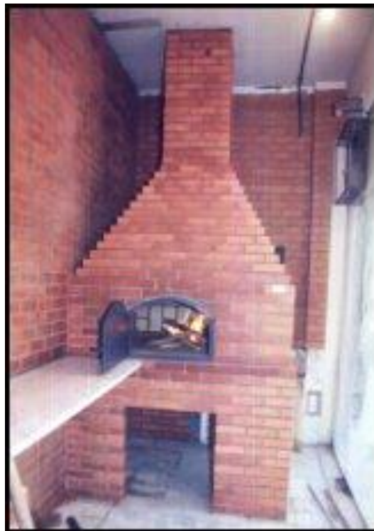
FOUR Type «PIZZA»