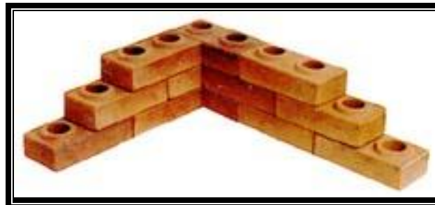
ASSEMBLAGE de BLOCS Creux STABI