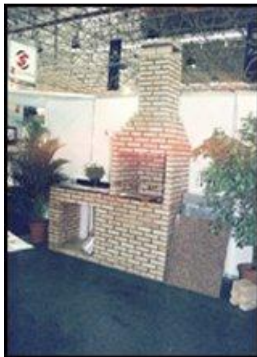
FOUR dans un JARDIN